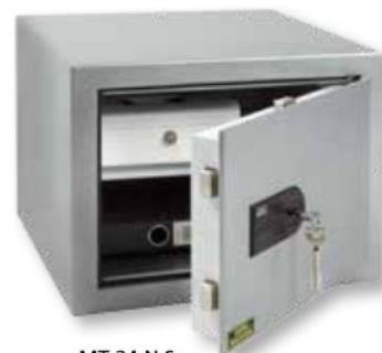
MT 24 N S