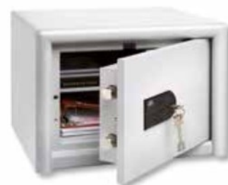
CL 10 S