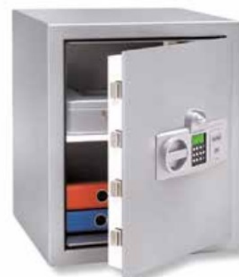
MT 26 N E FS