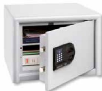
CL 20 E