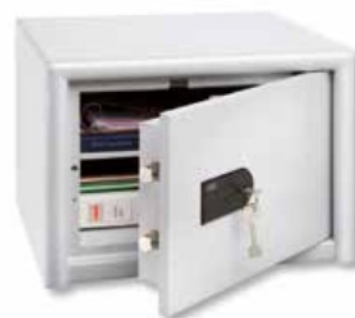
CL 20 S