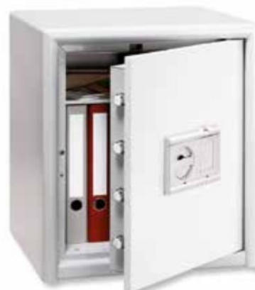
CL 40 E FS