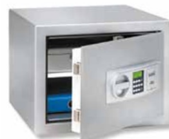
MT 24 N E