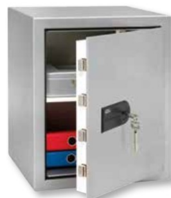
MT 26 N S