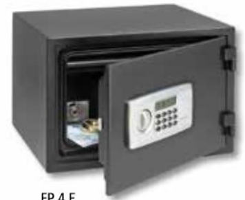
FP 4 E